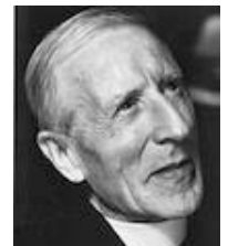
Teilh. de Chardin